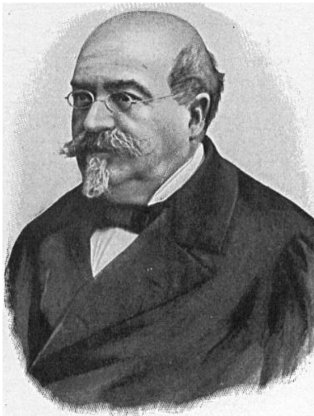
Mihail Kogălniceanu Михаил Когалничеану

Ситуацијата во Југо-Источна Европа станува се понестабилна, летото 1875 година во оваа зона започнуваат вооружените бунти против Отоманската Империја, која ги опустошувала земјите од регионот со тоа зголемувајќи ги апетитите за создавање на нивни автономни држави. Помеѓу овие вооружени востанија се вбројува и Разловачкото востание 1876 и Кресненското 1878 кои по себе придонесоа многу