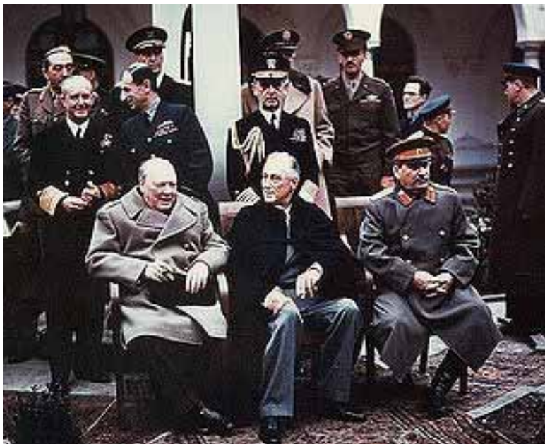
Începutul sfârșitului celui de al II-lea Război Mondial - Ialta Почетоком од крајот на II-ата Светска Војна Јалта

Statisticile făcute în urma celui de-al doilea război mondial îl consacra ca cel mai mare și