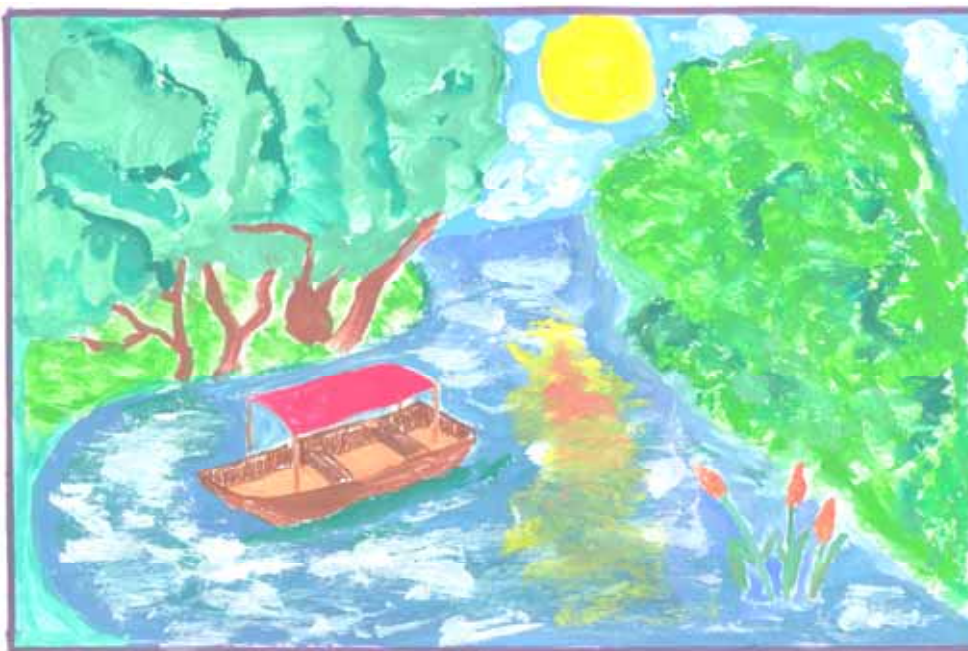
Акварел изработен од Штефаниа Петришор