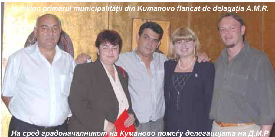
На сред градоначалникот на Куманово помеѓу делегацијата на Д.М.Р