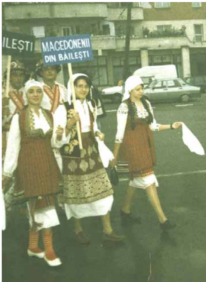
Македонците од Баилешти учествуваа и на парадата на народните носии