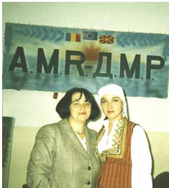
Во седиштето од Баилешти на Д.М.Р. Вратите се постојано отворени

La sediul din Băilești al A.M.R. Ușile sunt întoadeаuna deschise