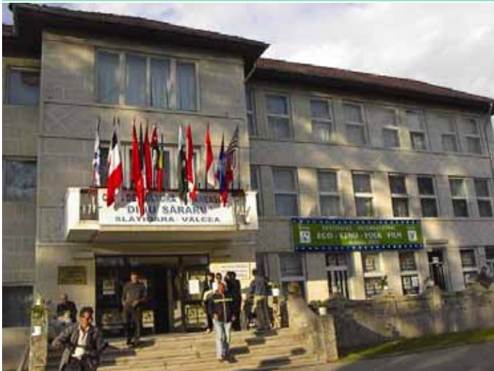
Casa de Cultură din Slătioara